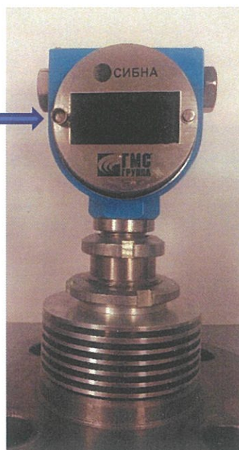
Рис. 1. Внешний вид влагомера.