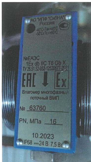
Рис. 3. Маркировочная табличка влагомера.

Фотография маркировочной таблички приведена на рисунке 3.