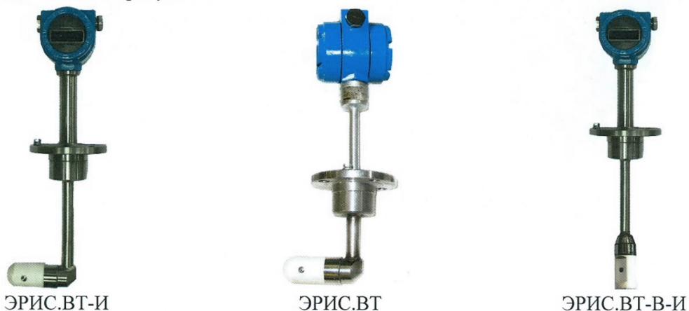
Рисунок 1 – Общий вид датчиков расхода ЭРИС модификации ВТ

Пломбировка от несанкционированного доступа датчиков расхода ЭРИС осуществляется нанесением знака поверки давлением на специальную мастику, установленную в чашечке винта крепления платы индикации или защитного экрана, расположенных под передней крышкой электронного преобразователя. Схема пломбировки от несанкционированного доступа, обозначение мест нанесения знака поверки датчиков расхода ЭРИС представлена на рисунке 4.