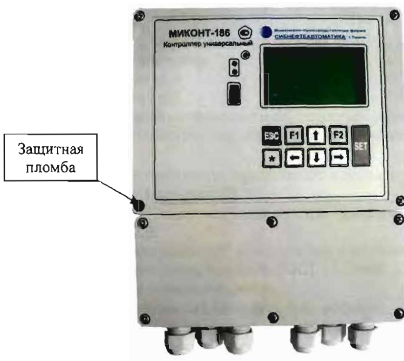
Рисунок 4– Схема пломбировки контроллера МИКОНТ от несанкционированного доступа.