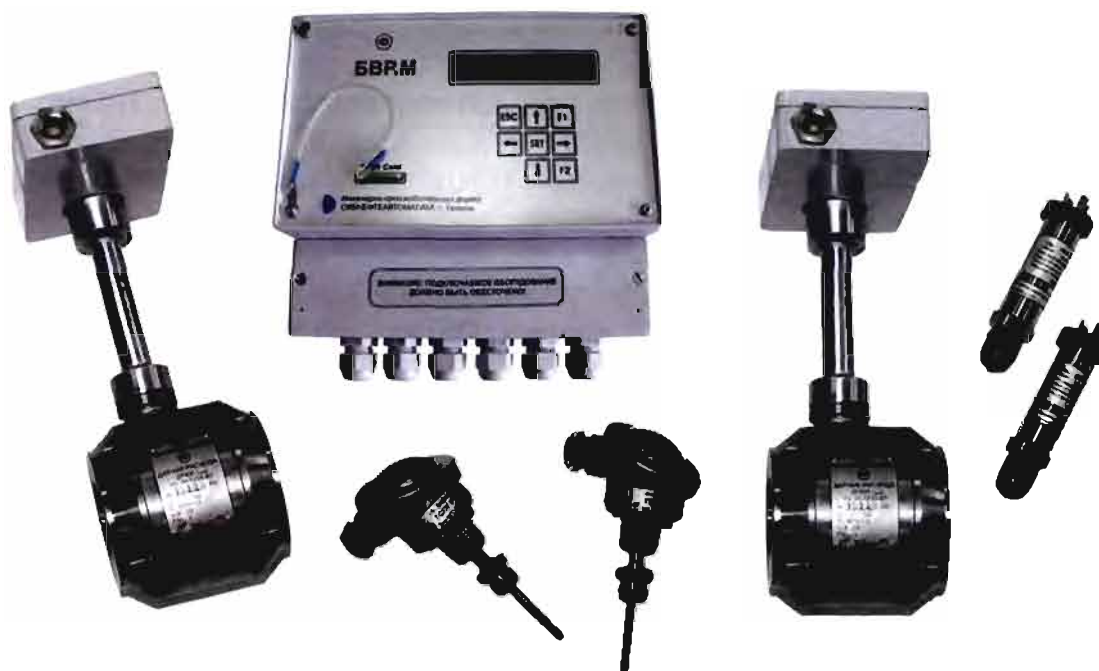
Рисунок 1 – Счетчик тепловой энергии СТС.М-50.