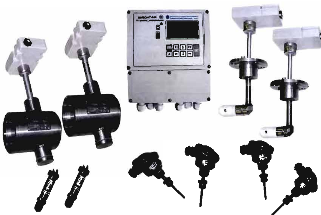
Рисунок 2 – Счетчик тепловой энергии СТС.М-80В-200.