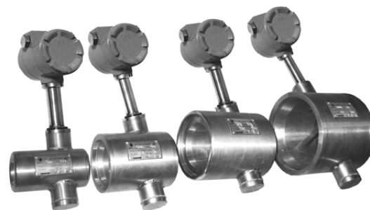
БЛОК ВЫЧИСЛЕНИЯ РАСХОДА БВР.М